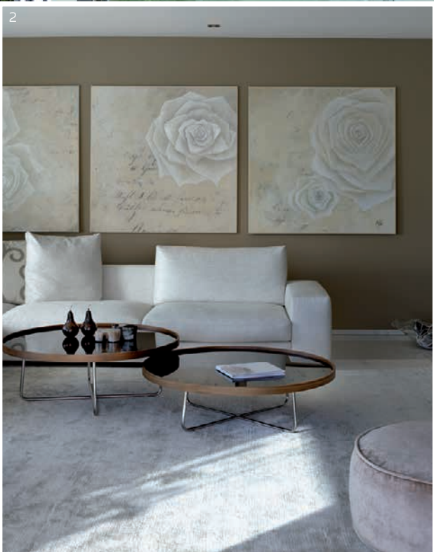
I+2_ Weiche Formen und Materialien sowie harmonisch aufeinander abgestimmte Beige- und Brauntöne hüllen den Raum in eine ausdrucksstarke Ruhe. Blickpunkte sind neben dem weitläufigen Ausblick in die umgebende Landschaft, die drei in Öl gefassten Rosenbilder.